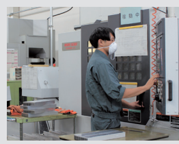
製造課(マシニング加工)