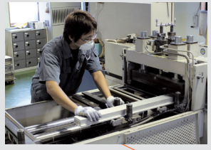
製造課(素材切断工程)