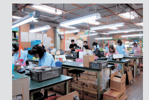
出荷管理課(梱包・出荷作業)