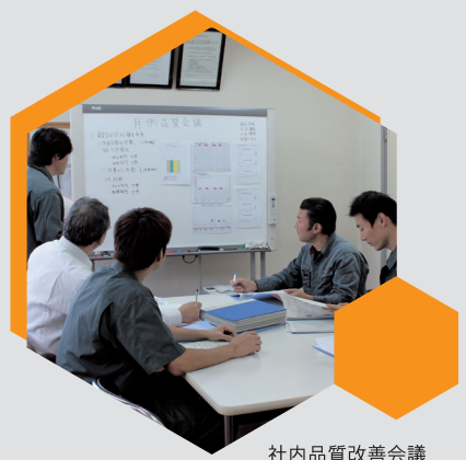
社内品質改善会議

製造ラインフローの虫メガネマークは弊社の作業 工程における厳密な検査や、その徹底した取組み について表わしたもので、それにより製品不良率 0.05%以下を実現しております。