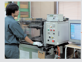
品質管理課(エアリーク試験)